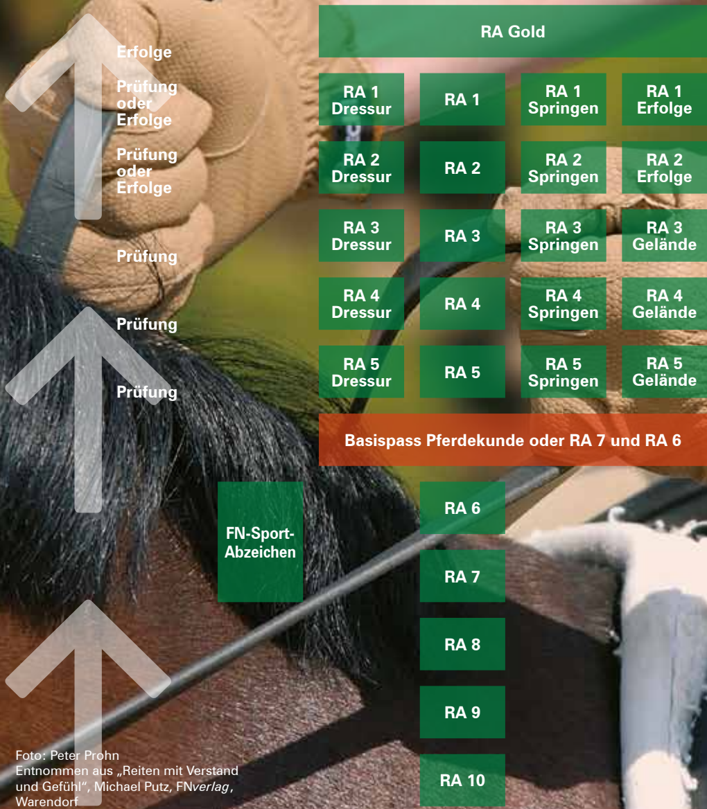
Foto: Peter Prohn Entnommen aus „Reiten mit Verstand und Gefühl“, Michael Putz, FNverlag, Warendorf